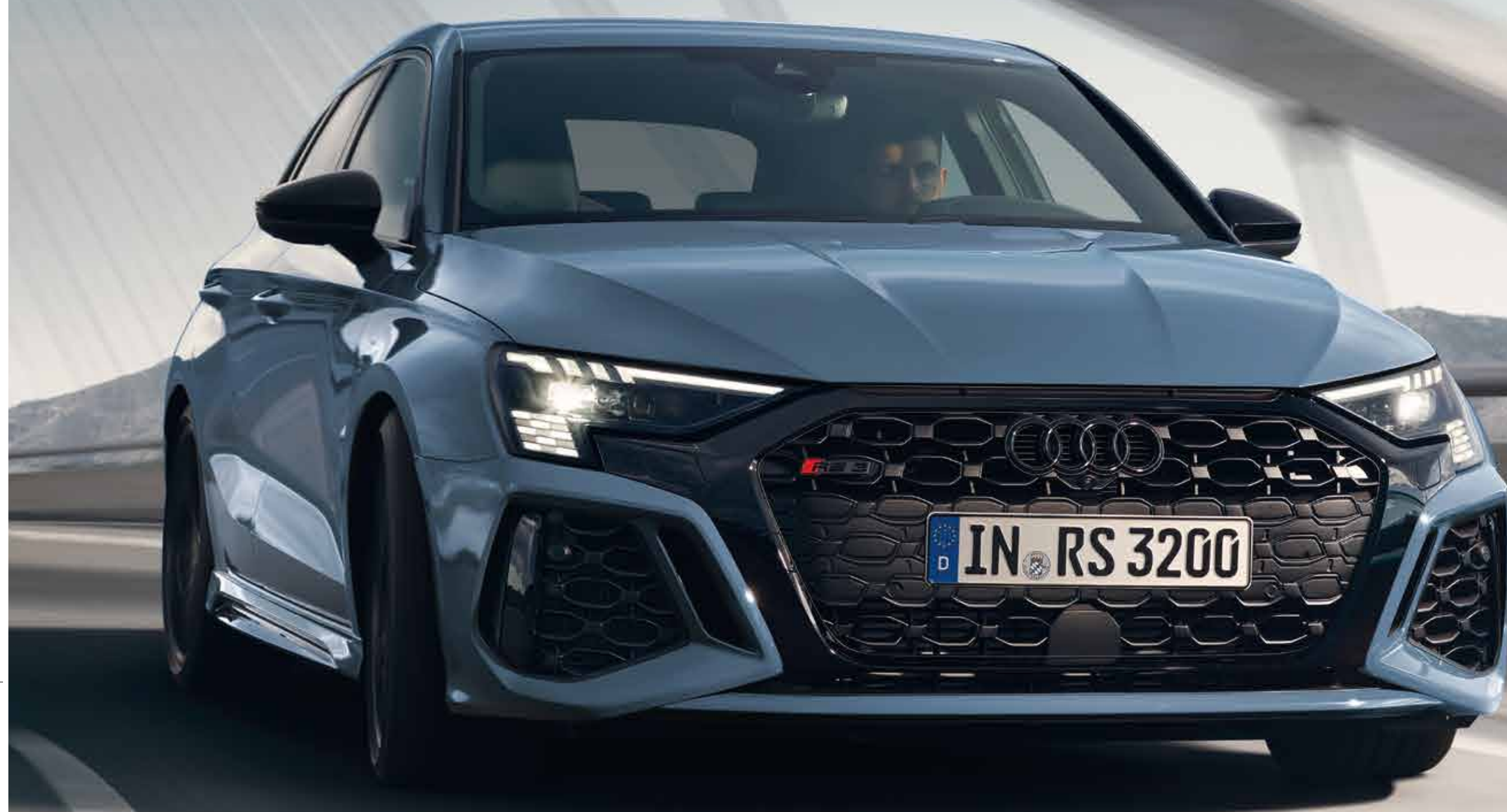
MY24 Audi RS 3 Sportback [オプション装着車] [欧州仕様車]