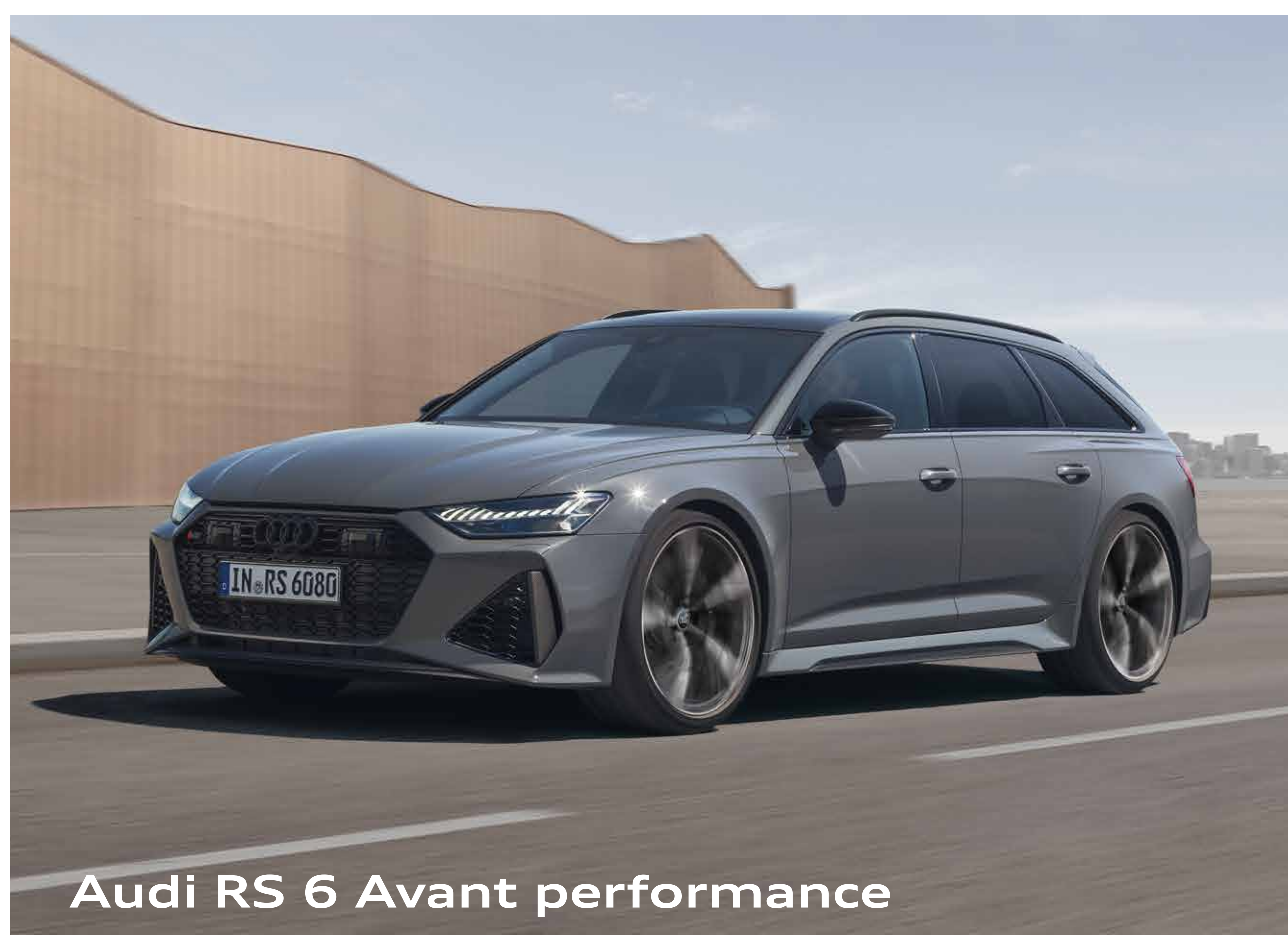
Audi RS 6 Avant performance